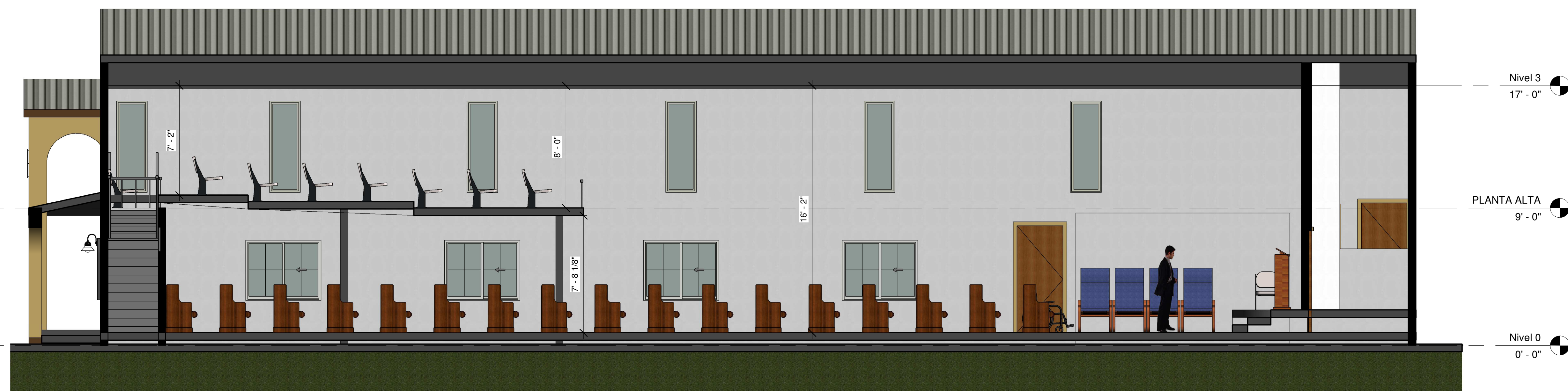
3 SANTUARIO NUEVO 1/4" = 1'-0"