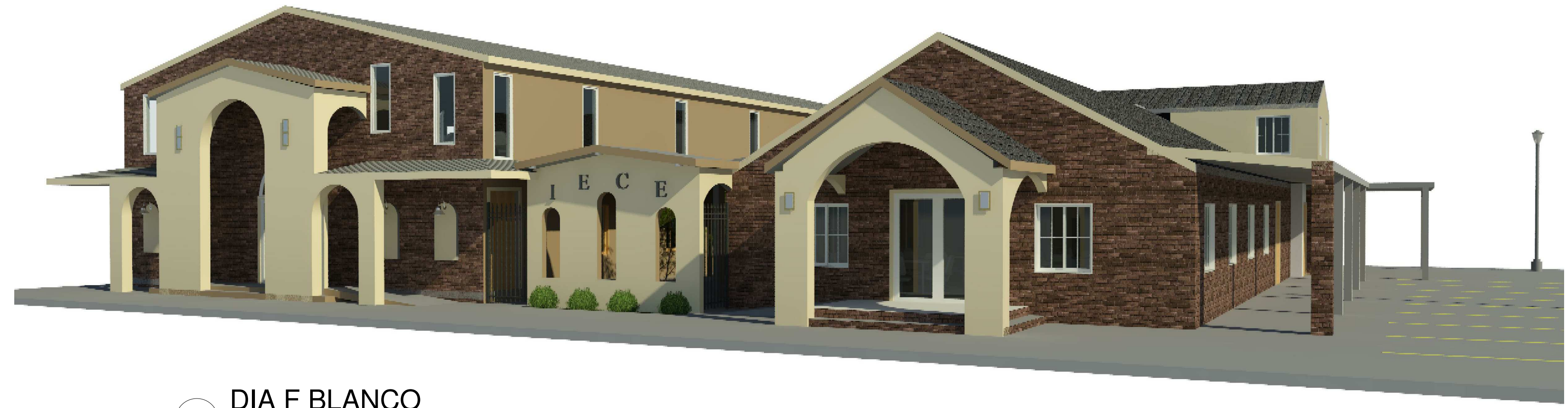
1 DIA F BLANCO 6" = 1'-0"

PLANO / DRAWING: VISTAS 3D CLAVE / CODE: 0001-A104