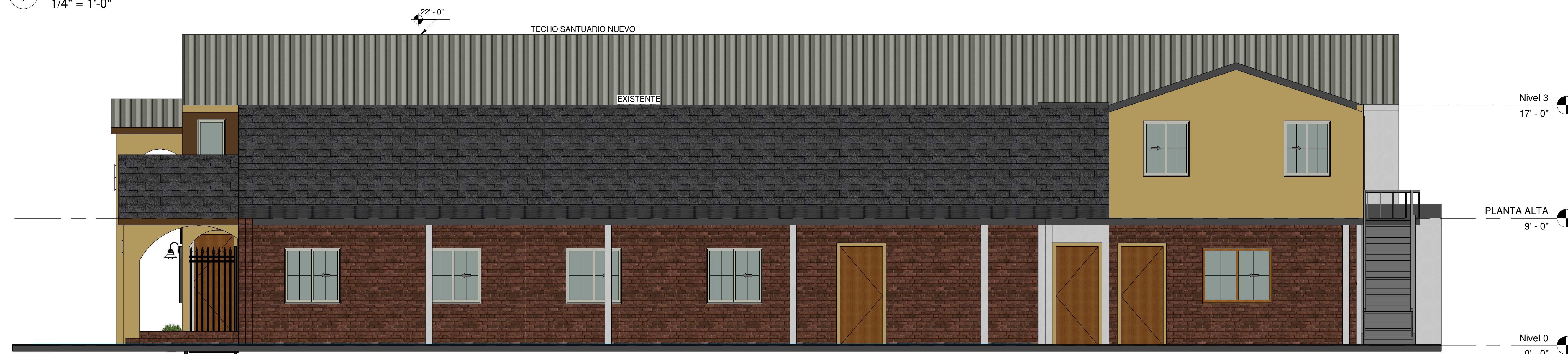
2 LATERAL WEST 1/4" = 1'-0"