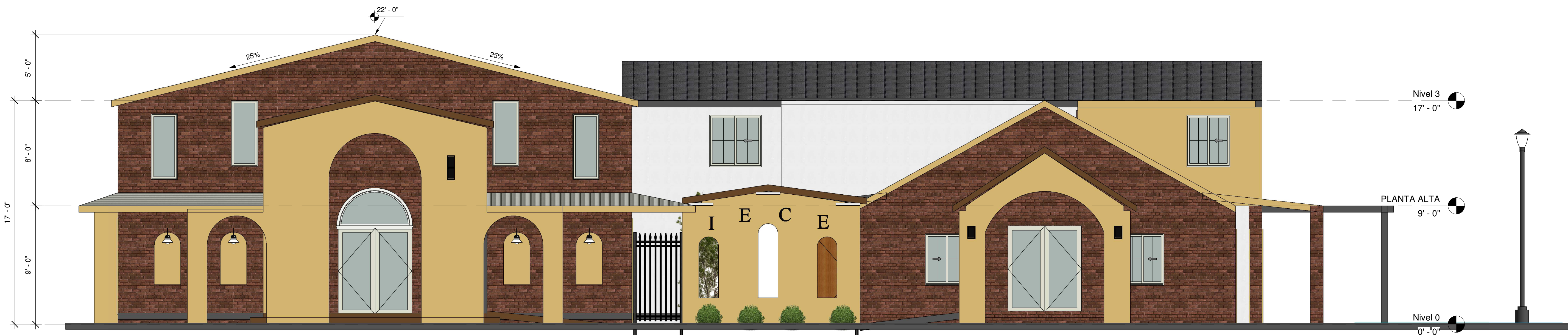
1 PRINCIPAL 1/4" = 1'-0"